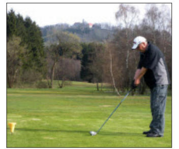
Das Wahrzeichen Poppenreuts, die Wallfahrtskirche Wollaberg, ist fast an jedem Loch zu sehen.